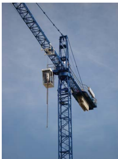
über den Kran